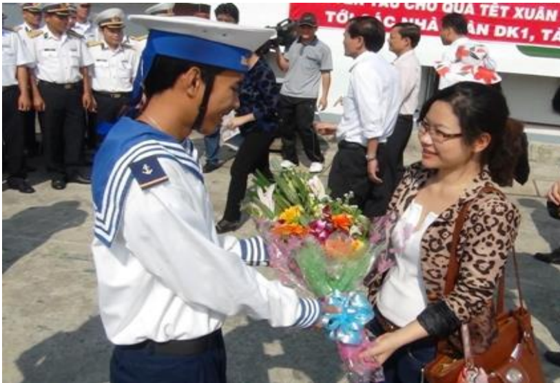
Niềm vui của chiến sĩ khi được khách đất liền ra thăm, chúc Tết

Còn bao chàng trai trẻ trong phút nhớ nhà, chỉ biết tâm sự với chính mình hay với sóng biển. Thế mới hiểu các anh trông đợi tin tức từ đất liền biết nhường nào. Nhiều khi cả hơn hai tháng mới có tàu thay trực. Nhận được thư người thân, lính đảo cứ truyền tay nhau đọc mà san sẻ niềm vui. Mỗi khi có đoàn ra giao lưu, các anh đều đón tiếp nồng nhiệt chân thành, để rồi bịn rịn lúc chia tay. Thời gian gặp nhau tuy ngắn ngủi, nhưng những lá thư xanh, dòng địa chỉ trao tay đã bù đắp phần nào nỗi cô đơn trong lòng họ.