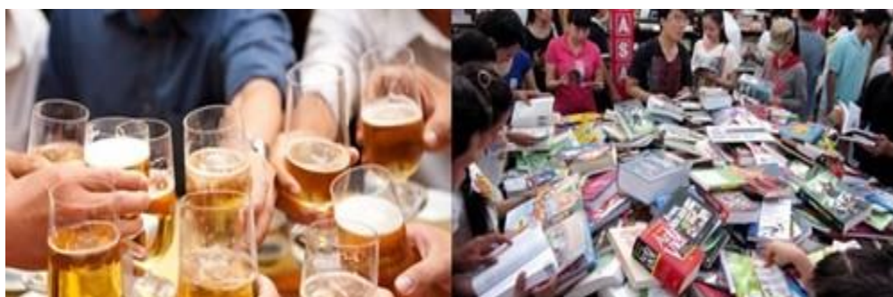
“Nhậu” nhiều, đọc ít và sự lên ngôi của văn hóa rẻ tiền

Người Việt chi ra 3 tỷ đô la để tiêu thụ 3 tỷ lít bia mỗi năm, nếu chia đều trên bình quân dân số mỗi người từ mới lọt lòng đến gần về thiên cổ sẽ “gánh” hơn 33 lít!. Một con số kinh hoàng, không sai nếu xếp bia rượu vào quốc nạn, nhớ ngày xưa Bác Hồ nói thực dân Pháp đầu độc dân tộc ta bằng rượu cồn... thì nay chúng ta đã tự mua cò đầu độc chính mình.