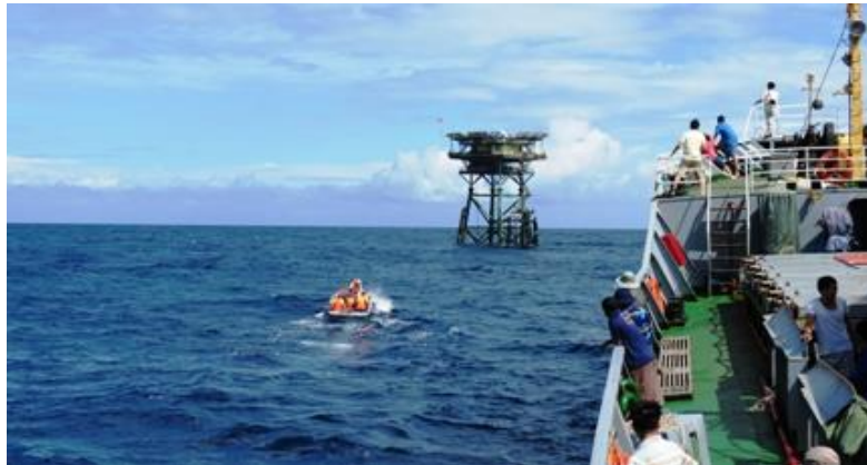
Tàu Hải quân đem quà xuân ra Nhà giàn DK1/11

“Một ba lô cây súng trên vai. Người chiến sỹ quen với gian lao”. Hành trang của người lính muôn đời vẫn là một tay súng, một chiếc ba lô, nhưng sự hy sinh và nỗ lực nhàn mà các anh đã trải qua thật khó nói hết bằng lời. Chiến tranh đi qua, cuộc sống của người lính biển đảo vẫn không một phút bình yên. Bởi ở nơi xa tiền tiêu Tổ quốc ấy, các anh đứng gác trong gió gào sương lạnh, làm nhiệm vụ thiêng liêng cao cả của mình để bảo vệ vùng trời vùng biển cho Tổ quốc.